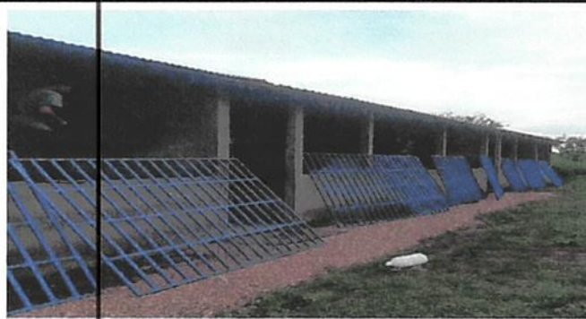
SUSTITUCIÓN DE BALCON DE METAL