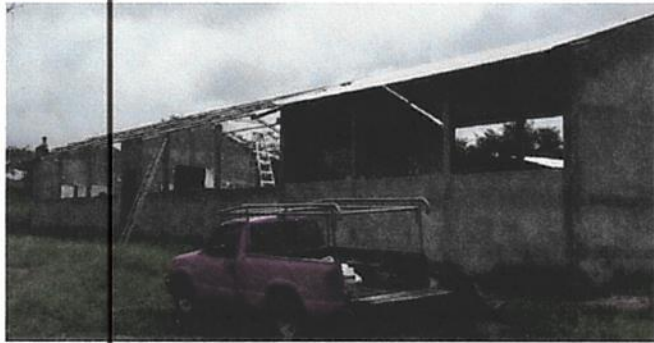
SUSTITUCIÓN DE LAMINA, POR LAMINA TROQUELADA ALUZINC CALIBRE 26