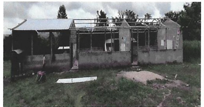
SUSTITUCIÓN DE SOPORTE DE MADERA, POR METAL