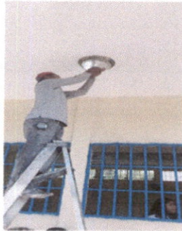
Foto 3: Instalación de focos en las lamparas del corredor y en las aulas