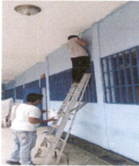
Foto1: Pintado las paredes externas