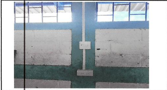
Foto1: SUSTITUCION DE INTERRUPTORES DOBLES