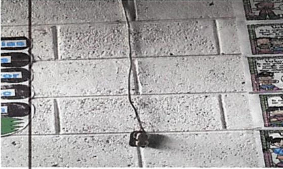
Foto1: SUSTITUCION DE PLAFONERAS