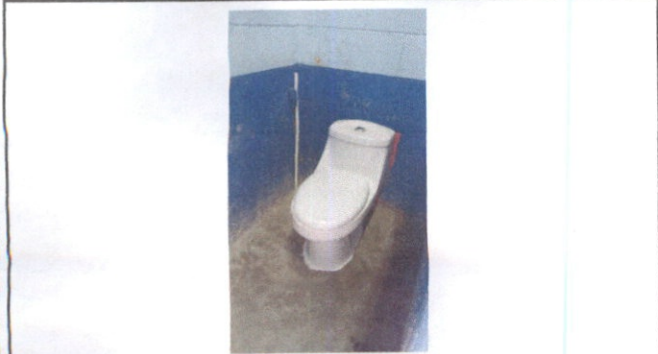
Foto1: Sustitucion de inodoros