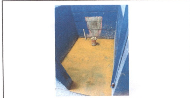
Foto 4: Reparacion de piso, torta de cemento en servicios sanitarios