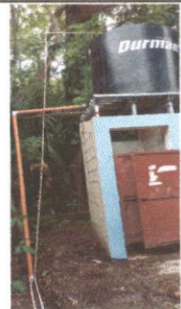
COMO PODEMOS OBSERVAR SE COMPRO UN TINACO O TANQUE O DEPOSITO DE AGUA PARA LOS BAÑOS LAVABLES.

Observación: Si es necesario se pueden agregar hojas adicionales y actualizar el número de hojas.