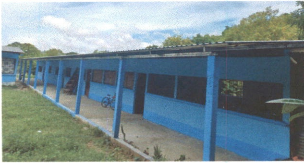
COMO PODEMOS OBSERVAR EN LA IMAGEN EL TECHO HA SIDO COLOCADO REMOZAMIENTO CONCLUIDO