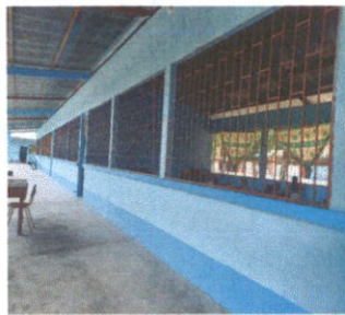
COMO SE PUEDE OBSERBAR SE REALIZO EL PROCESO DE PINTADO DE TODAS LAS AULAS