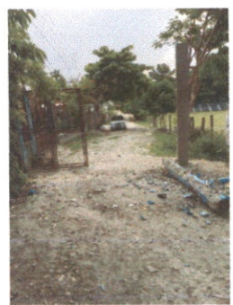
COMO PODEMOS OBSERVAR EL TRABAJO DE LA REALIZACIÓN DE LOS MURO O COLUMNAS ESTA CONCLUIDO