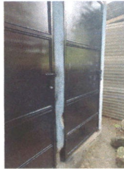
COMO SE OBSERVA EN LA IMAGEN LAS 4 PUERTAS DE BAÑOS SANITARIOS ESTAN COLOCADAS