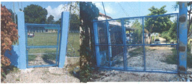
COMO SE PUEDE OBSERBAR EN LA IMAGEN LOS PORTONES HAY SIDO LIJADOS, SEPILLADOS, COLOCACIÓN DE MAYA PEQUEÑA Y PINTADO