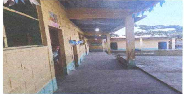
SUSTITUCIÓN DE CANAL DE PVC