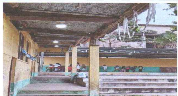
SUSTITUCIÓN DE LAMPARA AHORRADORA

Observación: Si es necesario se pueden agregar hojas adicionales y actualizar el número de hojas.