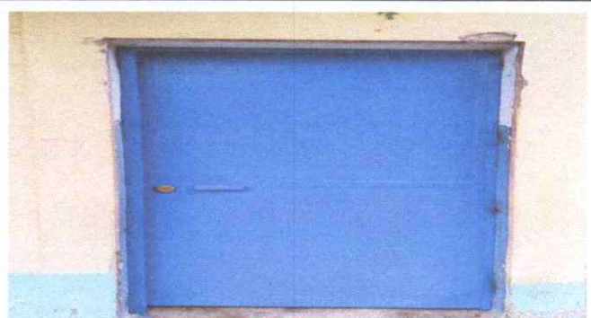
SUSTITUCIÓN DE PUERTAS EN SERVICIOS SANITARIOS