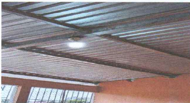
SUSTITUCIÓN DE PLAFONERAS