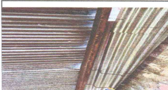
SUSTITUCIÓN DE ESTRUCTURA DE SOPORTE DE METAL POR METAL