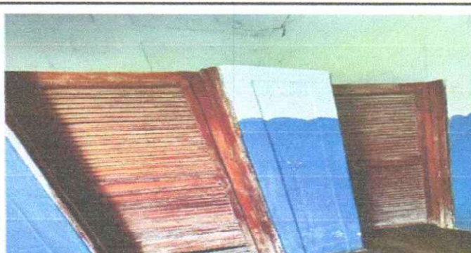
SUSTITUCIÓN DE PUERTAS EN SERVICIOS SANITARIOS