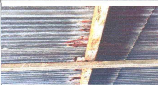
SUSTITUCIÓN DE LAMINA, POR LAMINA TROQUELADA ALUZINC CALIBRE 26