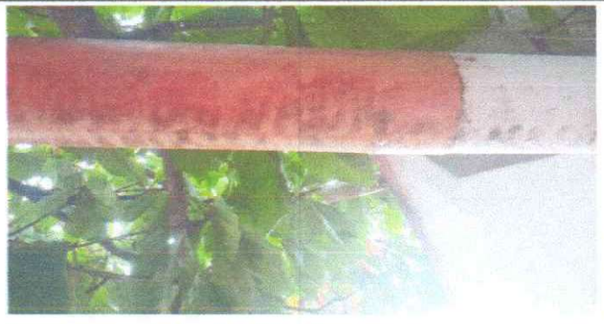
SUSTITUCIÓN DE CANAL DE PVC