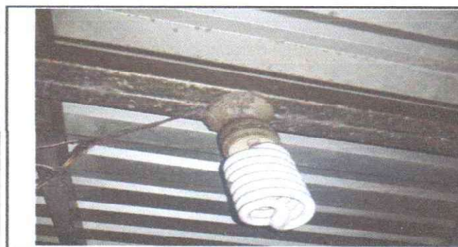
SUSTITUCIÓN DE PLAFONERAS