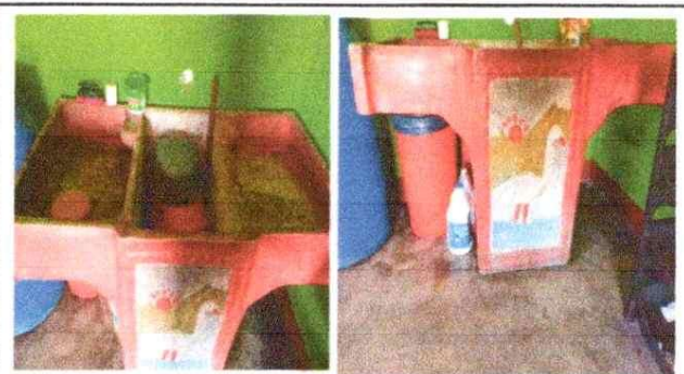
Foto 2: Mejoramiento de pila de concreto en cocina e instalacion de drenajey accesorios pvc, instalacion de tuberia llaves y accesorios pvc.