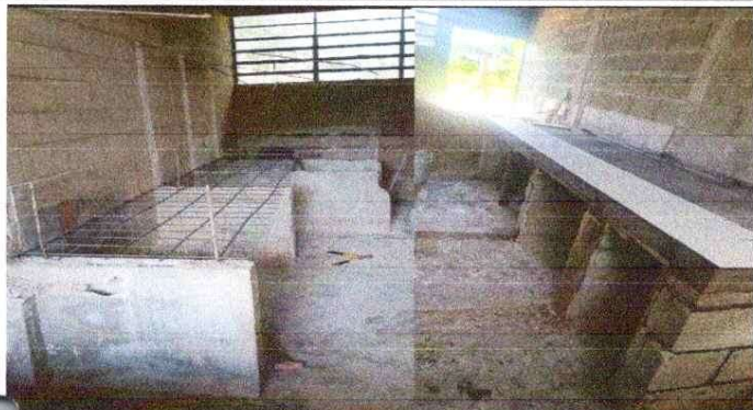
Foto1: MEJORAMIENTO REPARACION DE COCINA, Mejoramiento de estufa rural (completa) incluye chimenea y plancha de metal