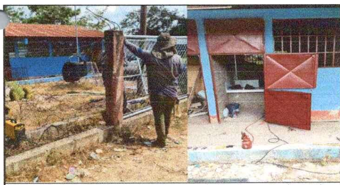
Foto 5: MEJORAMIENTO Fabricación e instalación de puertas de metal