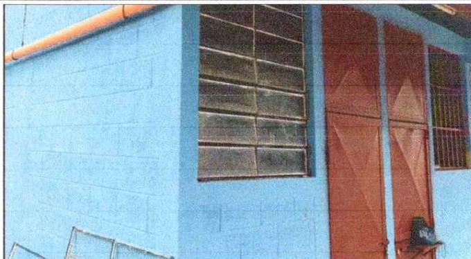
Foto 2: MEJORAMIENTO Fabricación e instalación de ventana-balcon de metal