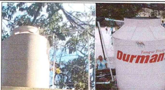
Foto2: MEJORAMIENTO DE ACCESORIOS DE TINACO 1100 LTS, SUSTITUCION DE CONCRETO