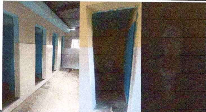
Foto1: MEJORAMIENTO SERVICIOS SANITARIOS Y SUS ACCESORIOS : MEJORAMIENTO DE PUERTAS