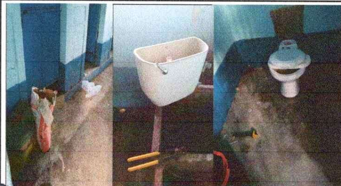
Foto1: MEJORAMIENTO SERVICIOS SANITARIOS Y SUS ACCESORIOS : MEJORAMIENTO DE PUERTAS