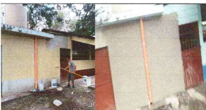
Foto 6 MEJORMIENTO DE PAREDES DE PINTURA DE PINTURA DE INTERIORES

Observación: Si es necesario se pueden agregar hojas adicionales y actualizar el número de hojas.