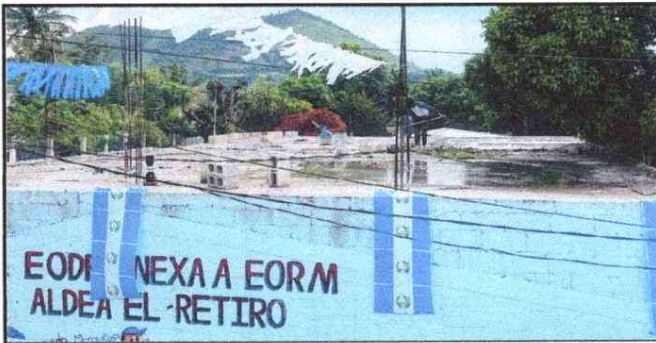
Foto 3: Impermeabilización y repación de pañuelos en losa ya que se filtra el agua en aula No. 1, afecta en la salud y proceso enseñanza aprendizaje de los alumnos (as).