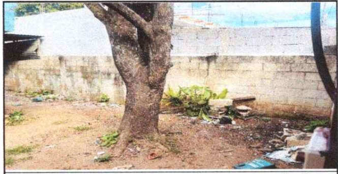
Foto 4: Reparación de muro de cocina y mejoramiento de repello gris en muro de cocina. Debido a las constantes lluvias se filtra el agua, por ello se generó moho lo cual perjudica a la salud de los estudiantes.