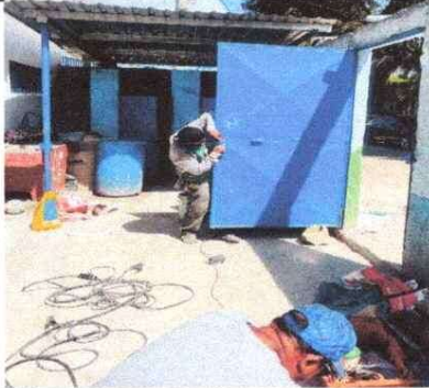
Foto 1: Mantenimiento de chapa en puerta de entrada principal que se encuentra por desprenderse.