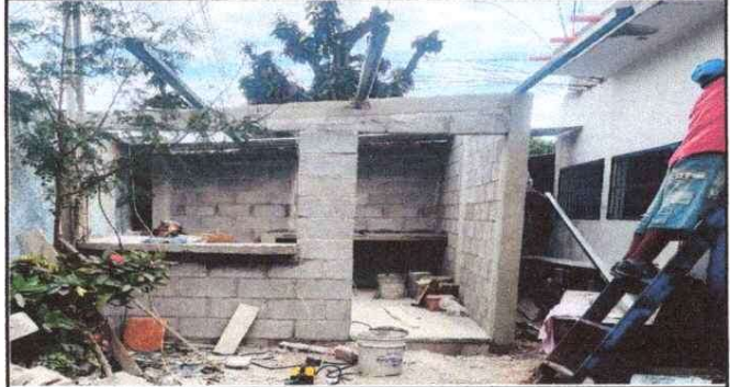
Foto 2: Mejoramiento de cocina que se encuentra en mal estado debido a las inclemencias del tiempo.