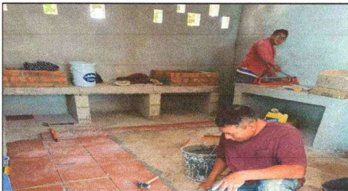
Foto 3: MEJORAMIENTO DE COCINA, SUSTITUCIÓN DE ESTUFA RURAL COMPLETA INCLUYE CHIMENEA Y PLANCHA DE METAL.