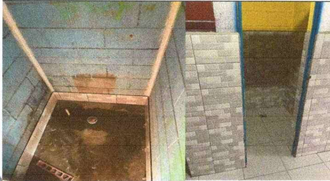
Foto1: SUSTITUCIÓN DE INODOROS