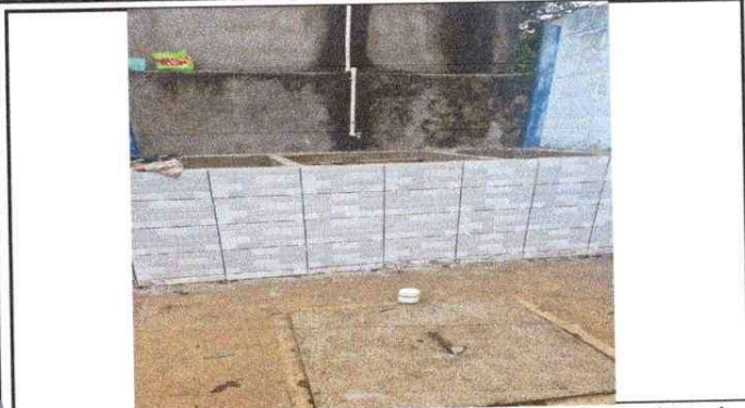
Foto1: SUSTITUCIÓN DE PILA DE CONCRETO ARMADO Mejoramiento de Tubería de Agua Potable