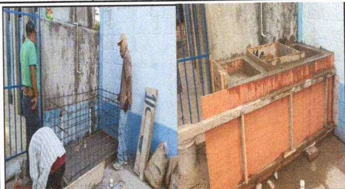
Foto1: SUSTITUCIÓN DE PILA DE CONCRETO ARMADO Mejoramiento de Tubería de Agua Potable