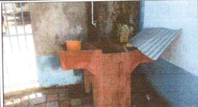
Foto 1: SUSTITUCIÓN DE PILA DE CONCRETO ARMADO Mejoramiento de Tubería de Agua Potable