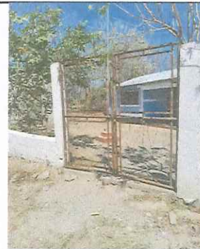
PORTON PRINCIPAL A CAMBIAR

Observación: Si es necesario se pueden agregar hojas adicionales y actualizarlas en el sistema de hojas.