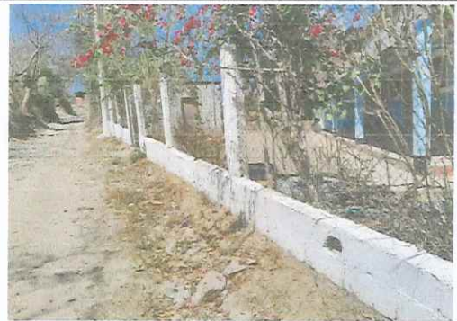
MURO PERIMETRAL A MEJORAR