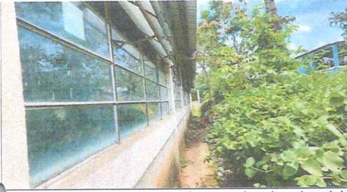
Foto 1: meioramiento de muro perimetral trasero, colapsado por humedad y lluvia en 2023