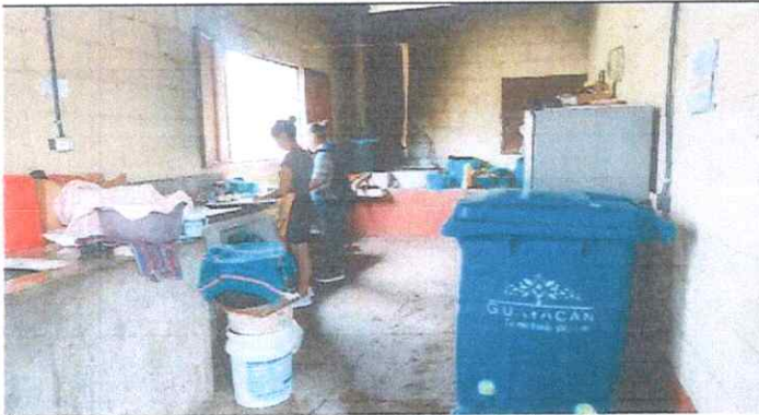
Foto 3: meioramiento de cocina en condiciones inadecuadas para preparación de alimentos