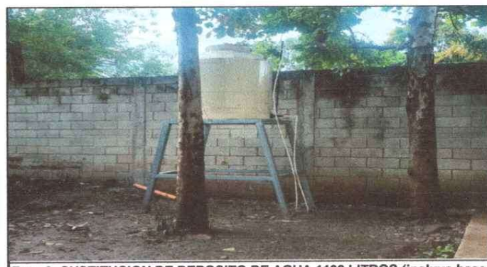
Foto 6: SUSTITUCION DE DEPOSITO DE AGUA 1100 LITROS (incluye base y tubería)

Observación: Si es necesario se pueden agregar Hojas adicionales y actualizar el número de hojas.