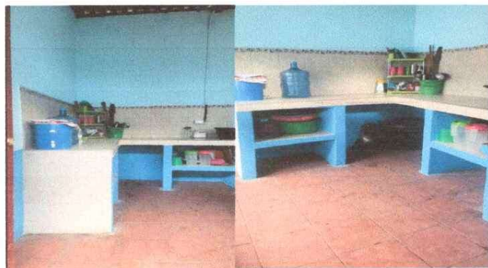
Foto 4: REPARACION DE AZULEJO EN ESTUFA RURAL, INSTALACION DE AZULEJO EN MUEBLE DE COCINA, INSTALACION DE PISO CERAMICO ANTIDESLIZANTE