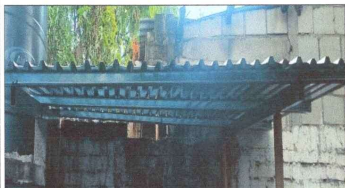
Foto 3: SSUSTITUCION DE LAMINA TROQUELADA ALUZINC CALIBRE 26, SUSTITUCION DE ESTRUCTURA DE SOPORTE DE METAL DE TECHO EN COCINA