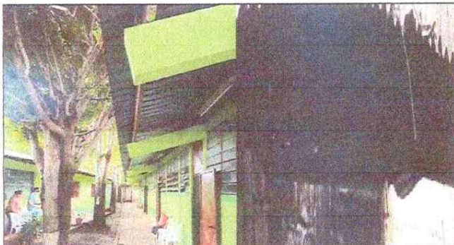
Foto 3: SUSTITUCION DE LAMINA TROQUELADA ALUZINC CALIBRE 26, SUSTITUCION DE ESTRUCTURA DE SOPORTE DE METAL DE TECHO EN COCINA