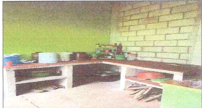
Foto 4: REPARACION DE AZULEJO EN ESTUFA RURAL, INSTALACION DE AZULEJO EN MUEBLE DE COCINA, INSTALACION DE PISO CERAMICO ANTIDESLIZANTE