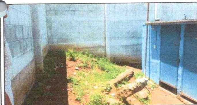
Foto 5: Sustitución de Inodoros, fabricación de puertas de metal, Instalaciones sanitarias