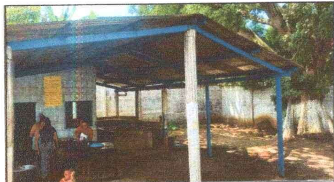
Foto 4: FUNDICIÓN DE PISO DE CONCRETO Y PISO CERAMICO ANTIDESLIZANTE