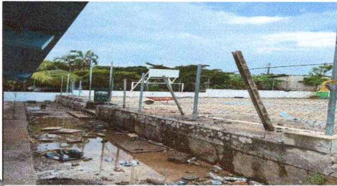
Foto1: Reparación de muro de block.