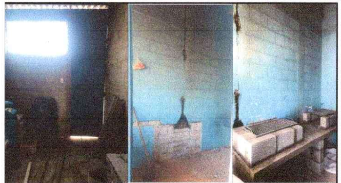
Foto 2: Sustitución de estufa rural completa incluye chimenea y plancha de metal. Puerta de metal, fabricación e instalación de puerta de metal en cocina.