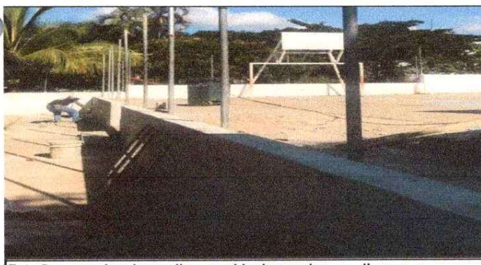
Foto 5: reparación de repello y cernido de paredes, repello en muro.