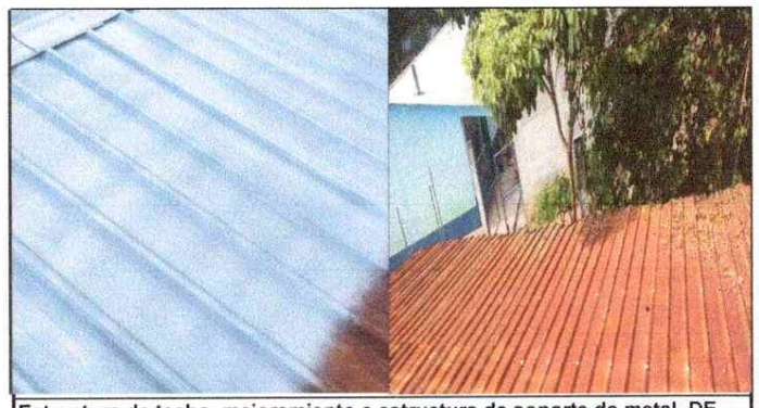
Estructura de techo, mejoramiento a estructura de soporte de metal. DE PORTON

Observación: Si es necesario se pueden agregar hojas adicionales y actualizar el número de hojas.