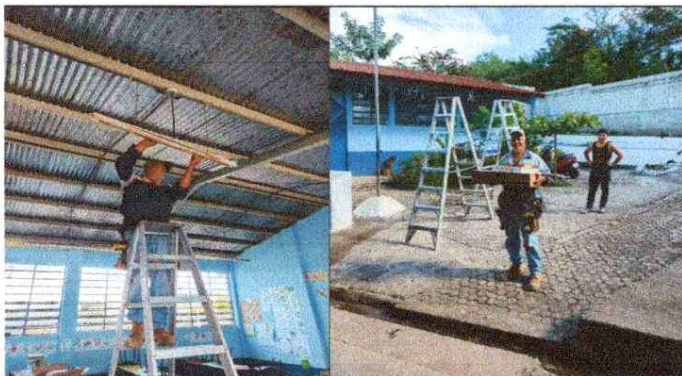
Foto 3: reparación de lamparas, sustitucion de toma corrientes dobles.