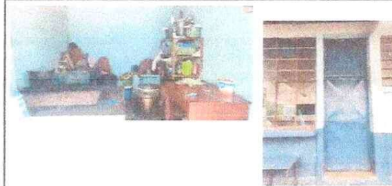
Foto 2: Sustitucion de estufa rural completa incluye chimenea y plancha de metal. Puerta de metal, fabricacion e instalacion de puerta de metal en cocina.