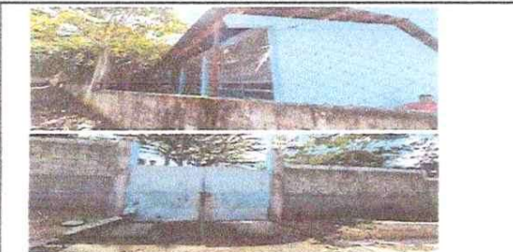
Foto 5: reparacion de repello y cernido de paredes, repello en muro.