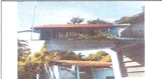
Foto 6: Estructura de techo, mejoramiento a estructura de soporte de metal.

Observación: Si es necesario se pueden agregar hojas adicionales y actualizar el número de hojas.