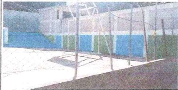
Foto1: Reparacion de muro de block.