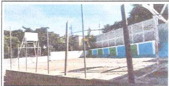
Foto 4: losa de patio, mejoramiento losa de patio para escenario.