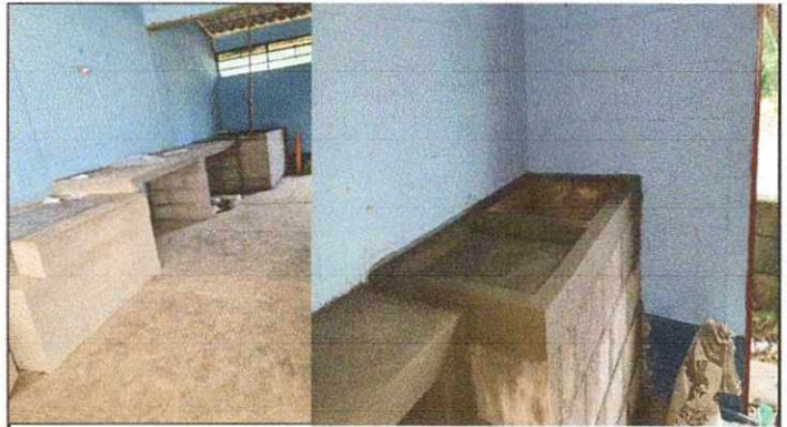
Foto 2: REPARACION DE COCINA, MEJORAMIENTO DE ESTUFA RURAL, SUSTITUCION DE ESTUFA RURAL COMPLETA INCLUYE CHIMENEA Y PLANCA DE METAL