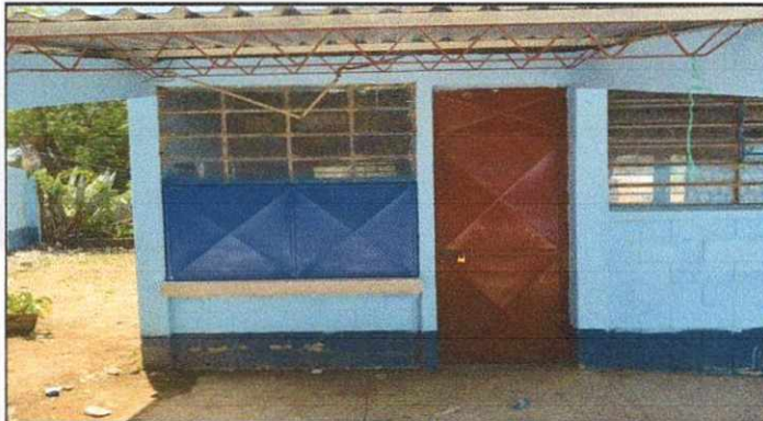
Foto 3: INSTALACION DE TUBERIA PVC, INSTALACION DE TUBERIA AGUA POTABLE