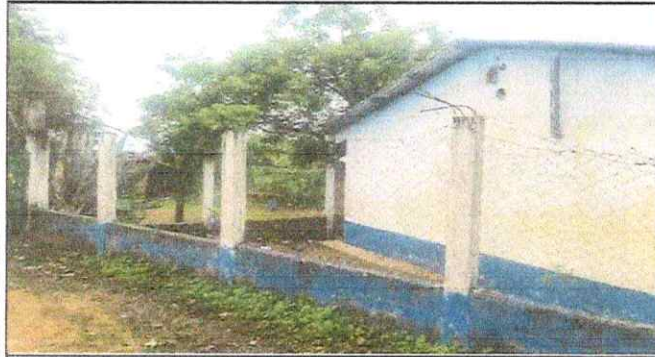
Foto1: REPARACION DE MURO PERIMETRAL DE BLOCK