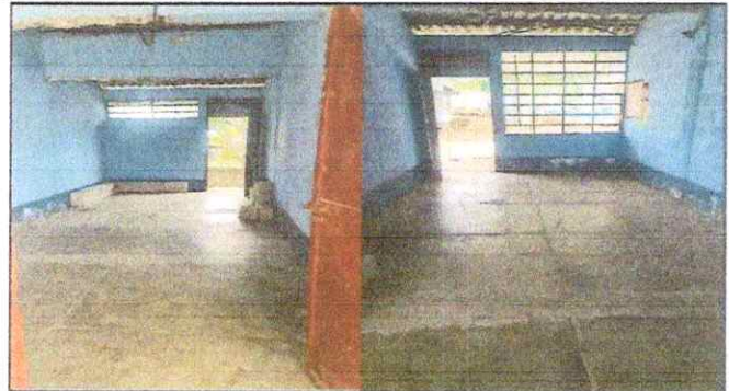
Foto 2: REPARACION DE COCINA, MEJORAMIENT DE ESTUFA RURAL, SUSTITUCION DE ESTUFA RURAL COMPLETA INCLUYE CHIMENEA Y PLANCA DE METAL