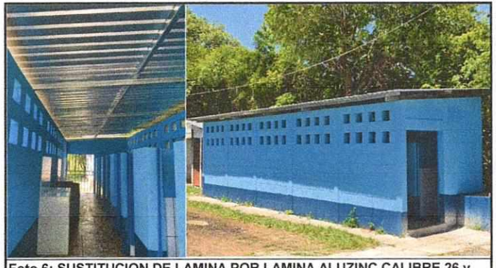
Foto 6: SUSTITUCION DE LAMINA POR LAMINA ALUZINC CALIBRE 26 y MEJORAMIENTO DE ESTRUCTURA DE SOPORTE DE METAL

Observación: Si es necesario se pueden agregar hojas adicionales y realizar el número de hojas.