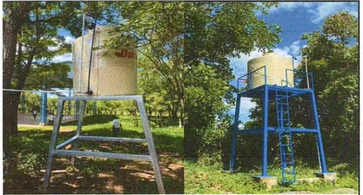
Foto 4: SUSTITUCION DE DEPOSITO DE AGUA DE 2,500 LITROS (incluye base metal) INSTALACION DE TUBERIA AGUA POTABLE