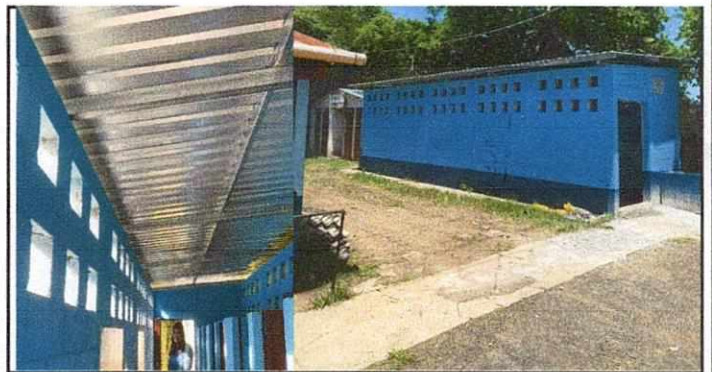
Foto 6: SUSTITUCION DE LAMINA POR LAMINA ALUZINC CALIBRE 26 y MEJORAMIENTO DE ESTRUCTURA DE SOPORTE DE METAL

Observación: Si es necesario se pueden agregar hojas adicionales y actualizar el número de hojas.