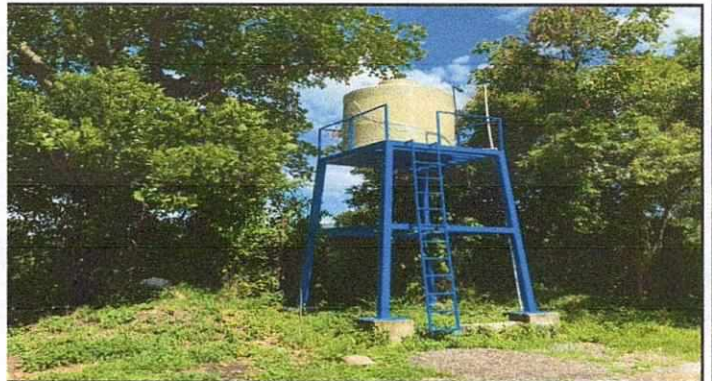
Foto 4: SUSTITUCION DE DEPOSITO DE AGUA DE 2,500 LITROS (incluye base metal) INSTALACION DE TUBERIA AGUA POTABLE