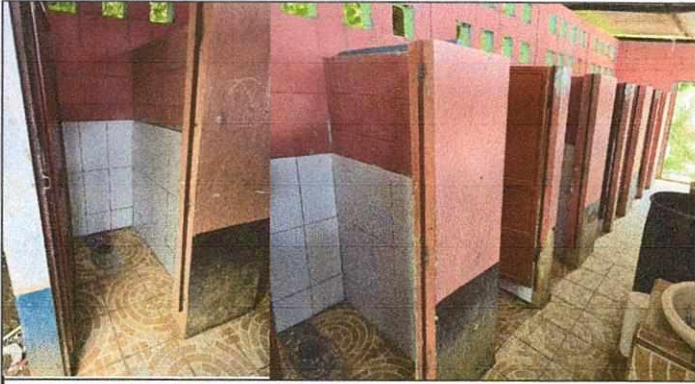
Foto1: INSTALACION DE INODOROS,