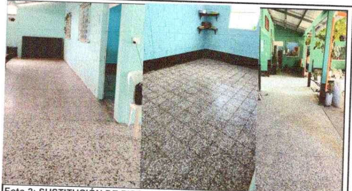
Foto 2: SUSTITUCIÓN DE PISO DE TORTA DE CONCRETO Y BASE DE CONCRETO DE PISO