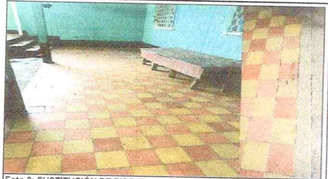
Foto 2: SUSTITUCIÓN DE PISO DE TORTA DE CONCRETO Y BASE DE CONCRETO DE PISO