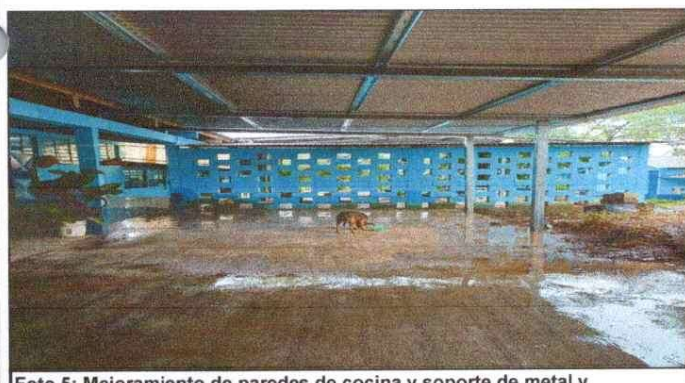
Foto 5: Mejoramiento de paredes de cocina y soporte de metal y sustitucion de lamina sutitucion de canal.