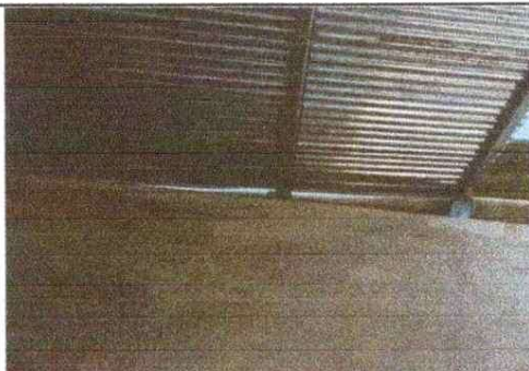
Foto 5: Mejoramiento de paredes de cocina y soporte de metal y sustrucción de lamina sustrucción de canal.