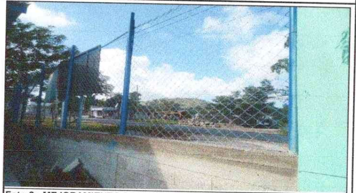
Foto 2: MEJORAMIENTO DE MURO DE PERIMETRAL DE BLOCK + CIMENTACIÓN