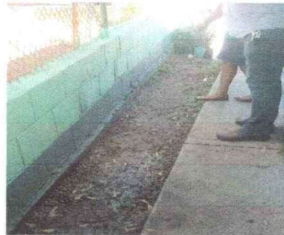
Foto 2: MEJORAMIENTO DE MURO DE PERIMETRAL DE BLOCK + CIMENTACIÓN