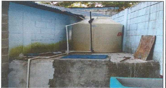
Foto 4: SUSTITUCION DE DEPOSITO DE AGUA 1100 LITROS (incluye base y tuberías) SUSTITUCION DE LAMINA POR LAMINA ALUZINC CALIBRE 26