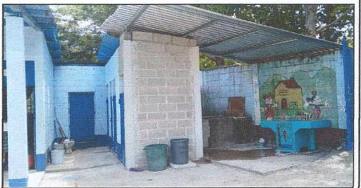
Foto 6: Mejoramiento de galera, Sustitución de pila, mejoramiento de losa de concreto en patio

Observación: Si es necesario se pueden agregar hojas adicionales y actualizar el número de hojas.