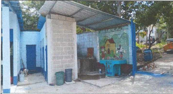
Foto 1: Mantenimiento Puerta de metal, lijado y pintura, cambio de sanitario, azulejo y pizo.