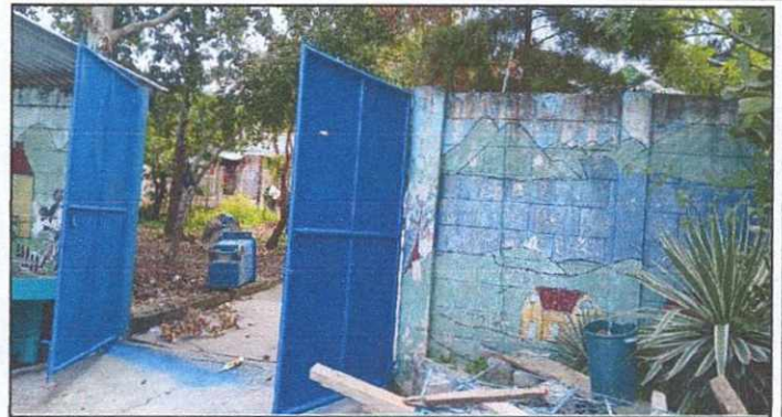
Foto 2: Mejoramiento Puerta de metal en bodega, lijado y pintura, cambio de una parte del metal deteriorado.