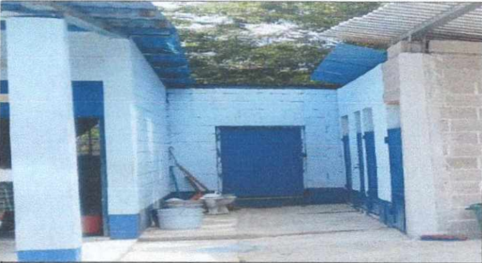
Foto 3: Fabricación y elaboración de paredes faltantes y puerta de metal, instalación de 2 Mingitorios