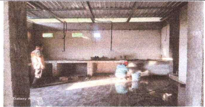
Foto 2. Albañiles pegando el piso ceramico en la ampliacion de la cocina.