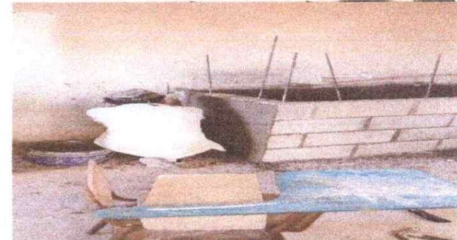
foto 4. construccion de pila