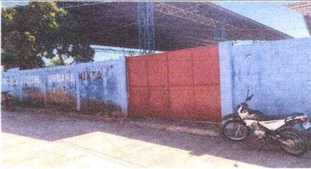
Foto1: ESCUELA BARRIO NORTE