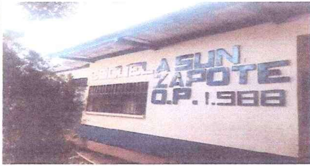
Foto1: ESCUELA SUNZAPOTE