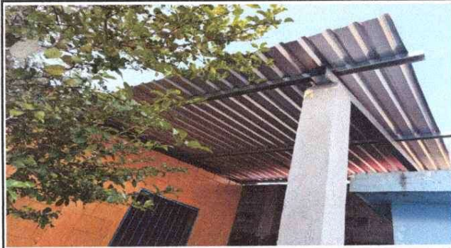
Foto 3: SUSTITUCIÓN DE LÁMINA, POR LÁMINA TROQUELEADA ALUZINC CALIBRE 26