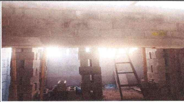
Foto1: AREA DE LA COCINA, CHIMENEA