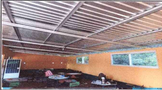
Foto1: MEJORAMIENTO DE TECHO Y COSTANERA