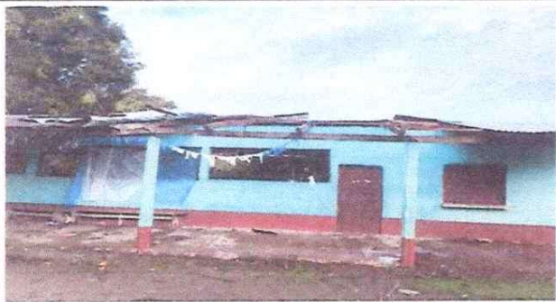
Foto1: MEJORAMIENTO DE TECHO Y COSTANERAS