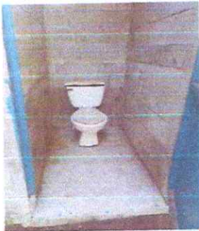
Foto 11: Sanitarios en malas condiciones a sustituir por sanitarios de cerámica lavables con sus accesorios nuevos