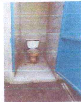
Foto 12: Sanitario y puerta de acceso en malas condiciones a sustituir.

Observación: Si es necesario se pueden agregar hojas adicionales y actualizar el número de hojas.