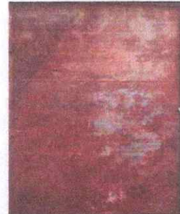
Foto 6: Sustitucion de puerta de lamina en mal estado por puerta metálica

Observación: Si es necesario se pueden agregar hojas adicionales y actualizar el número de hojas.