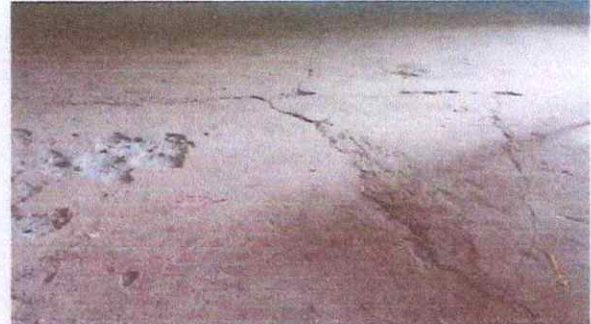
Foto 4: Piso de torta de cemento de cocina con grietas y agujeros para mejorar.