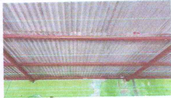
Foto 8: Estructura metalica en aula a sustituir por estructura portante galvanizada