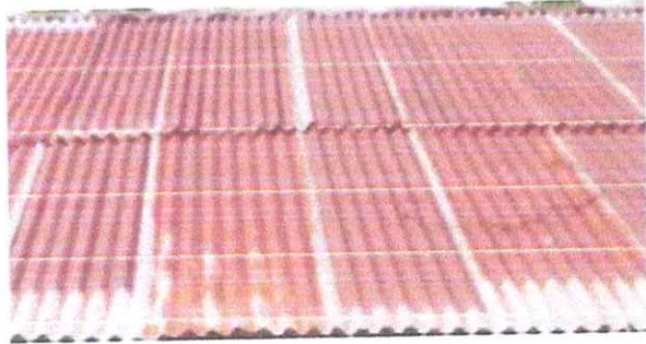
Foto 7: Lamina de techo de aulas en malas condiciones a sustituir por lamina nueva troquelada calibre 26