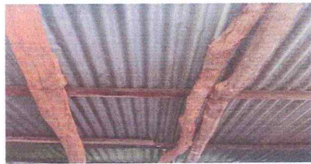
Foto 3: Estructura de soporte de madera dañada e inadecuada en cocina para sustituir por estructura portante galvanizada