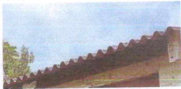
Foto 10: Lámina de Sanitarios en malas condiciones para sustituir con lámina troquelada calibre 26.