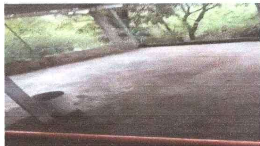
Foto 6: Mejoramiento de torta de cemento en area de acceso principal.

Observación: Si es necesario se pueden agregar hojas adicionales y actualizar el número de hojas.