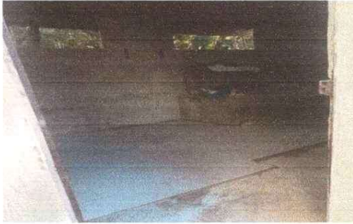
Foto 1: Módulo Sanitario: Torta de cemento a sustituir por piso cerámico y paredes a mejorar en area de sanitarios