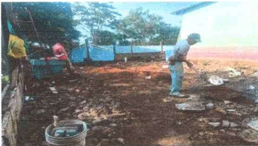
Foto 5: Módulo anexa a Cocina: Sustitución de lámina en mal estado por lámina troquelada calibre 26, sustitución de estructura portante de madera por estructura metálica galvanizada y cambio de pilares de madera por metal galvanizado. Area externa/anexa a cocina donde se encuentra pila de cemento