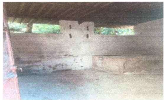
Foto 2: Módulo Cocina: Torta de cocina en mal estado para sustituir con piso cerámico, paredes dañadas a mejorar y para apertura de ventanas.