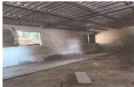
Foto 4: Módulo Aula: Piso y paredes de salón de clase en mal estado, mejoramiento con repello y piso ceramico