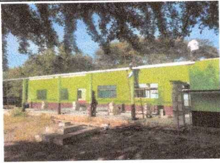
Foto1: Corredor de 2 aulas y direccion