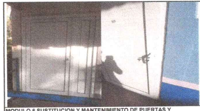
MODULO 6 SUSTITUCION Y MANTENIMIENTO DE PUERTAS Y VENTANAS

Observación: Si es necesario se pueden agregar hojas adicionales y actualizar el número de hojas.