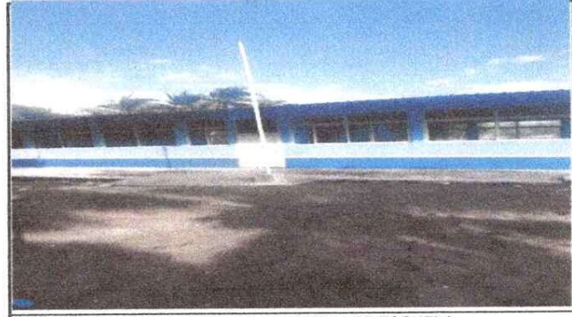
MODULO 4. PINTURA EXTERNA E INTERNA DE ESCUELA