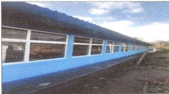
MODULO 1. SUSTITUCION Y MEJORAMIENTO DE ENTORTADO