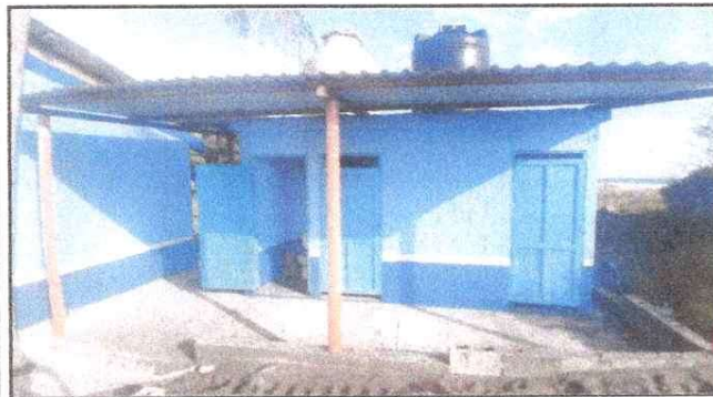
MODULO 3. SUSTITUCION Y MEJORAMIENTO DE SANITARIOS