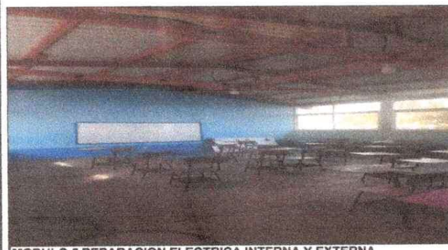
MODULO 5 REPARACION ELECTRICA INTERNA Y EXTERNA.