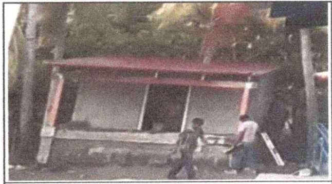
MODULO 2. MEJORAMIENTO DE COCINA