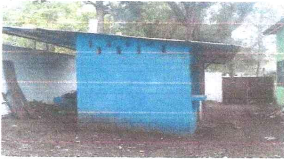
Foto 1: Modulo cocina: Paredes sin repello en mal estado, deteriorandose por mucha humedad.