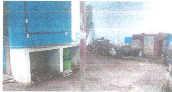
Foto 2: Modulo cocina: mueble de cocina y pared de pila con mucha humedad.