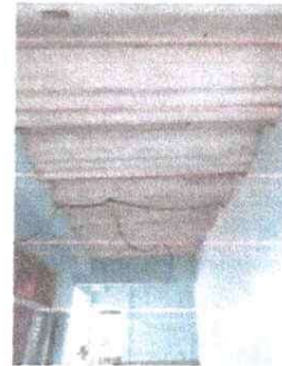
Foto 4: Modulo aulas: duralita en mal estado, servicio electrico dañado.