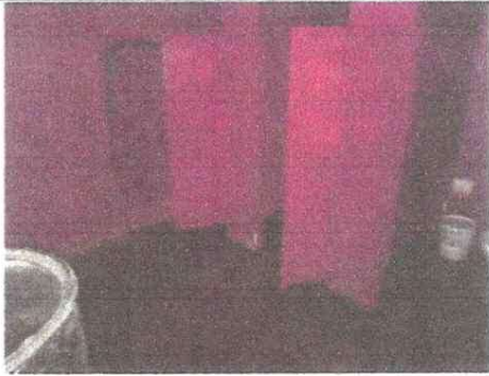
Foto7: Modulo baños sustitución de puertas de metal por puertas de metal, material legítimo.

Observación: Si es necesario se pueden agregar hojas adicionales y actualizar el número de hojas.