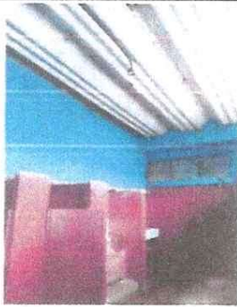
Foto 3: Modulo baños: paredes de baños en mal estado, ventanales dañados, techo de duralita podrido, falta de servicio electrico.