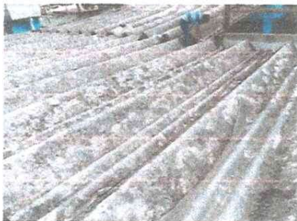
Foto 5: Modulo aulas: techo de duralita que cubre baños, tienda, direccion y salon de clases numero 5 en estado podrido.