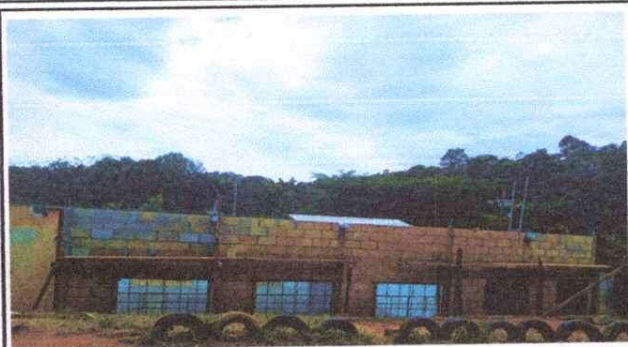
Foto1: Modulo Aula Sustitución de lamina, por lamina troquelada calibre 26