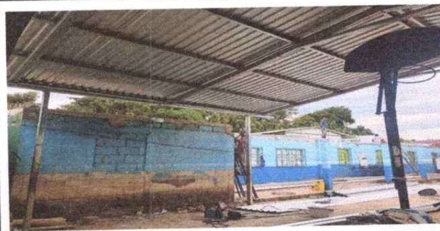
Foto 6: Modulo Aula: Sustitucion de costanera de madera a metal galvanizada

Observación: Si es necesario se pueden agregar hojas adicionales y actualizar el número de hojas.