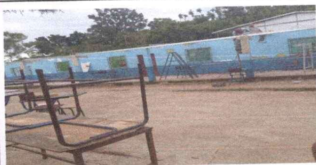
Foto 5: Modulo Aula: sustitucion de costaneras de madera a costanera metal galvanizada