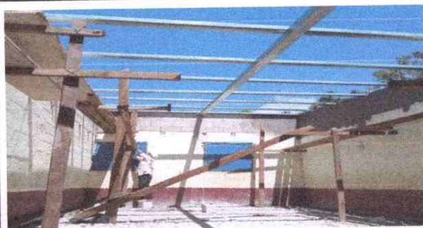
Foto 2: Modulo Aula, sustitucion de estructura de soporte de madera por metal