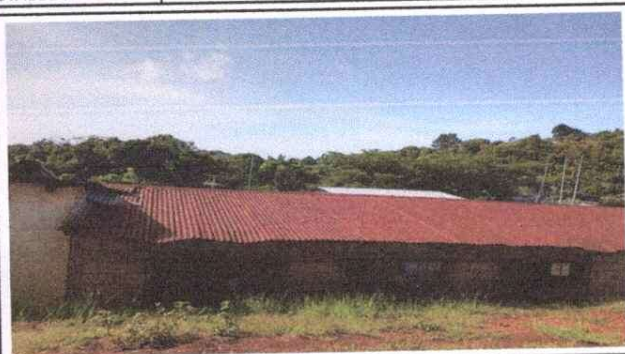
Foto1: Modulo Aula Sustitución de lamina, por lamina troquelada calibre 26