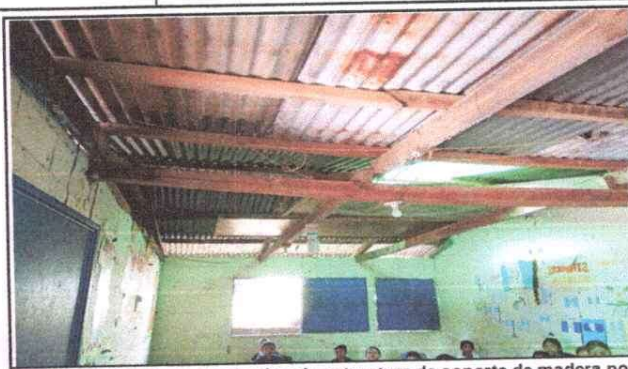
Foto 2: Modulo Aula, sustitucion de estructura de soporte de madera por metal