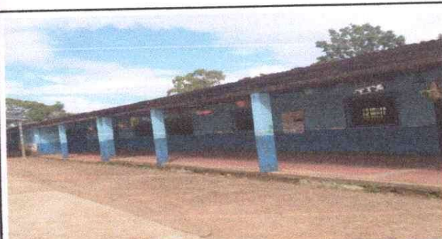
Foto 5: Modulo Aula: sustitucion de costaneras de madera a costanera metal galvanizada