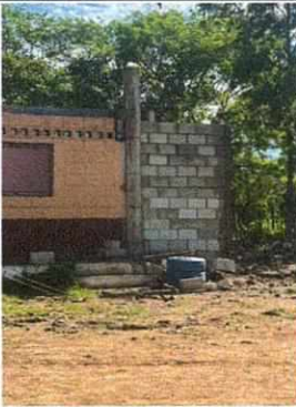
Foto 3: Mejoramiento y ampliación de pared de block de las aulas compartidas por párvulos, primero y segundo primaria.