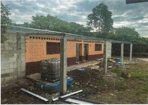
Foto 1: Sustitución de estructura galvanizada en las aulas de párvulos, primero y segundo primaria y trabajos adicionales para ampliación de techo de corredor dichas aulas