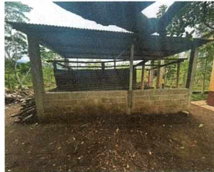
Foto 6: Mejoramiento y ampliación de paredes de cocina con block finalizado.

Observación: Si es necesario se pueden agregar hojas adicionales y actualizar el número de hojas.