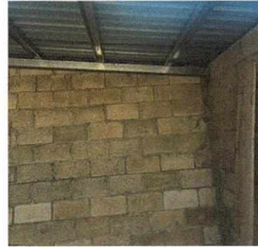
Foto 2: Culminación de trabajos de Instalación de lámina troquelada calibre 26 en aulas que comparten los niveles de párvulos, primero y segundo primaria