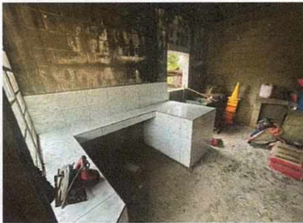
Foto 5: Mejoramiento de polletón y area de preparación con azulejo finalizado